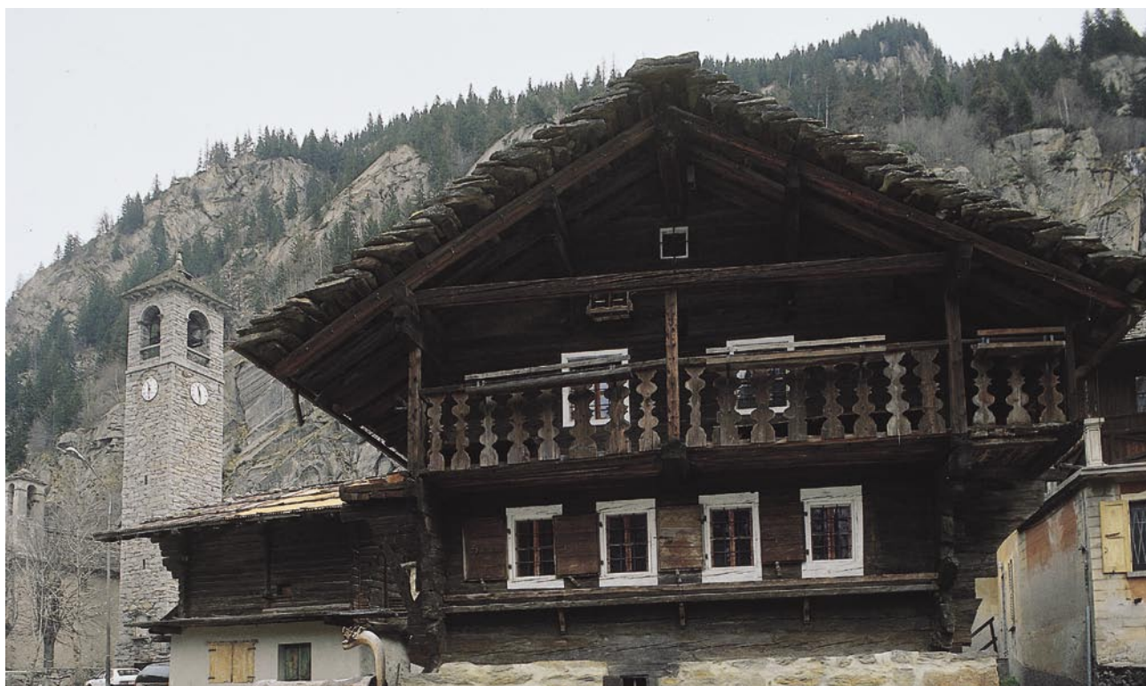
Valle Anzasca: il museo Walser di Borca.

le alte valli, i Walser conservano ancora oggi la loro antica parlata germanica e tradizioni di vita che affondano in età remote. Mirabili lo stile di costruzione delle case in legno a tronchi sovrapposti, la loro fedeltà alle attività della terra, al diritto consuetudinario, alla lingua degli avi. La lingua walser appartiene al mondo linguistico tedesco ed è anzi una delle sue espressioni più arcaiche. Fa parte della famiglia linguistica "alto alemanna", corrispondente all'area germanofona posta grosso modo a sud del Reno tra Svizzera e Foresta Nera. Apparentato all' alemanno alpino e svizzero-tedesco delle montagne , il walser ha mantenuto, chiuso tra le montagne, caratteri del tedesco delle origini e si caratterizza per una forte sonorità. Ma i Walser sono molto più di quella che può essere definita una minoranza di lingua tedesca in aree linguistiche diverse. Minoranza nelle minoranze, quella dei Walser non è una "enclave", bensì un complesso di "enclaves" linguistiche ed etniche sparse in gran parte dell'arco alpino, che fa della loro antica piccola civiltà un caso unico: quasi il prototipo degli uomini dell'alta montagna.